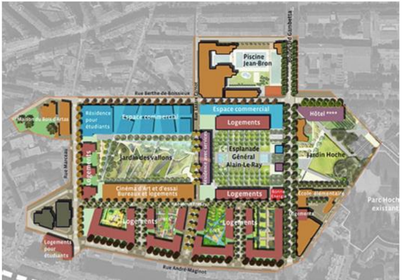
Doc 2 : L'éco-quartier de la caserne de Bonne à Grenoble

L'éco-quartier de la caserne de Bonne, c'est le premier éco-quartier à avoir vu le jour en France. Ce quartier construit sur le site d'une ancienne caserne militaire comprend :