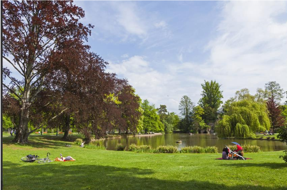
Parc de l'Orangerie à Strasbourg, France