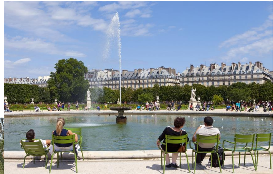
Jardin des Tuileries, Paris, France

Ils sont gratuits et accessibles à tous.