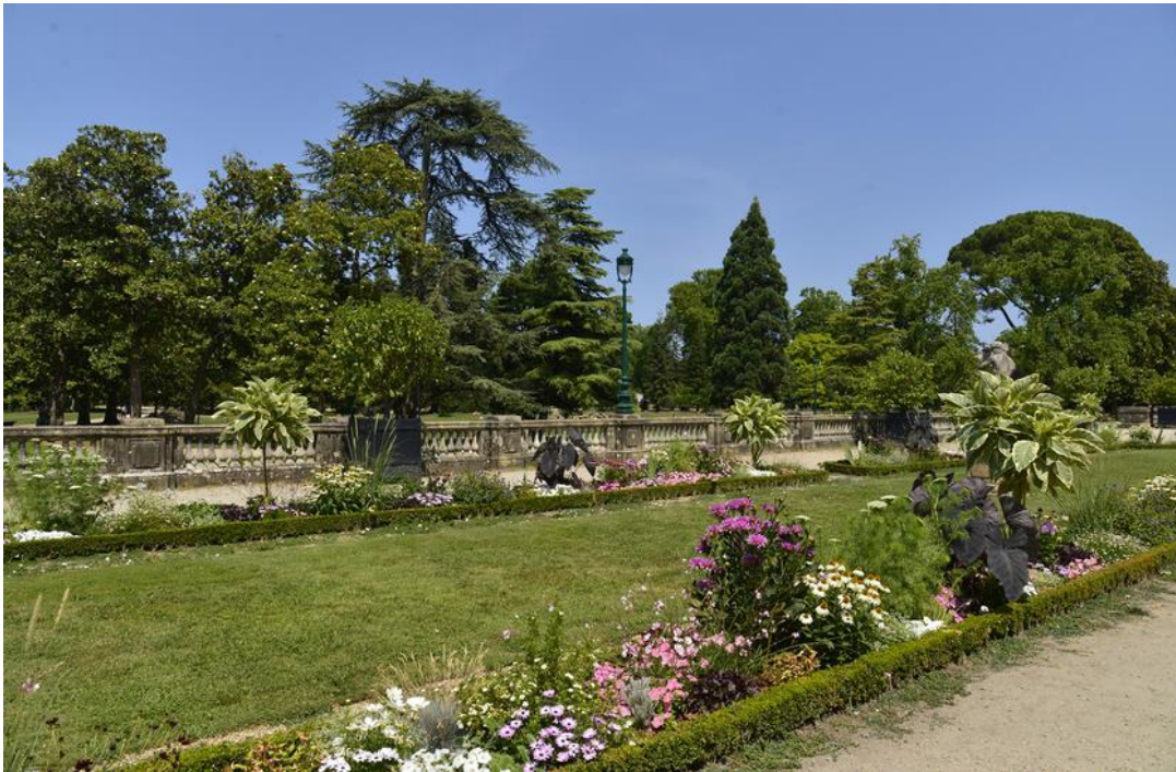
Jardin botanique de Bordeaux, France

En ville, on peut aussi trouver des jardins botaniques.