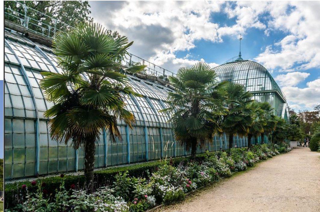
Jardin des serres d'Auteuil, Paris, France

Ces jardins spécialisés présentent des espèces végétales, parfois exotiques ou rares.