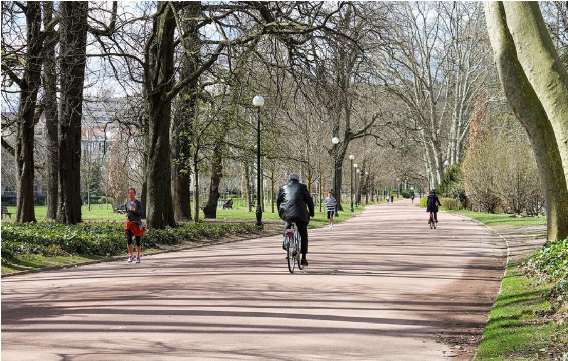
Parc de la tête d'Or, Lyon, France

Les espaces verts sont très appréciés des citoyens.