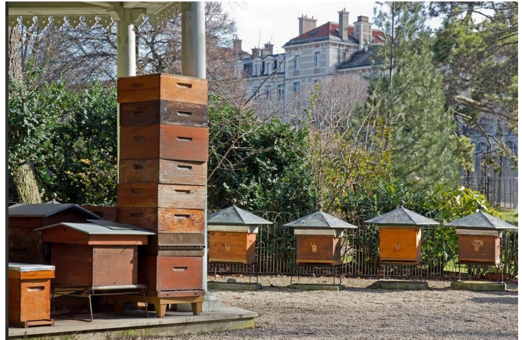
Ruches de la ville de Paris

Dans certaines villes, on installe aussi des ruches .