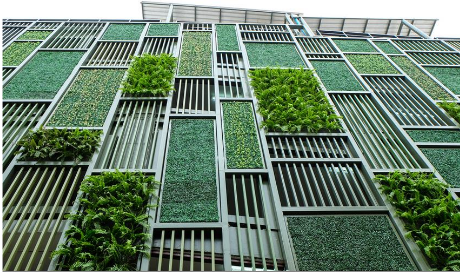
Façade végétale d'un immeuble

Aujourd'hui, la végétation prend une place importante dans le paysage urbain .