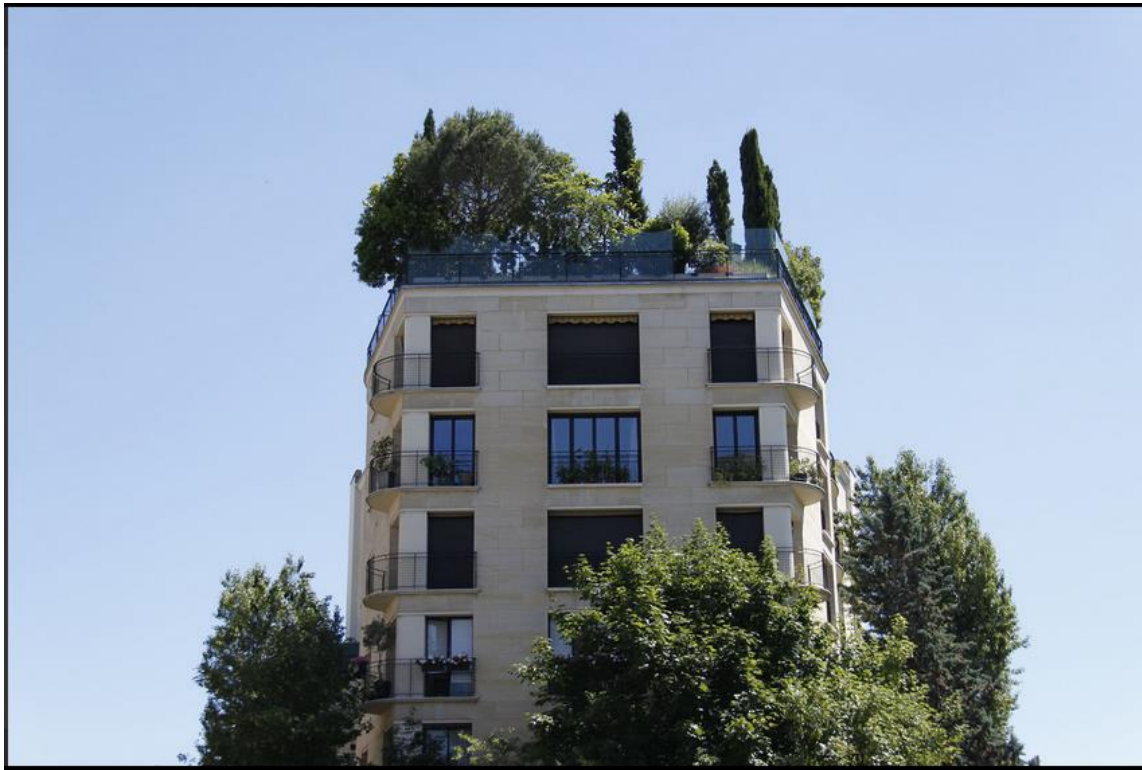
Végétation sur les toits d'un immeuble à Paris

Les bâtiments peuvent afficher des murs végétaux ou accueillir des jardins sur les toits.