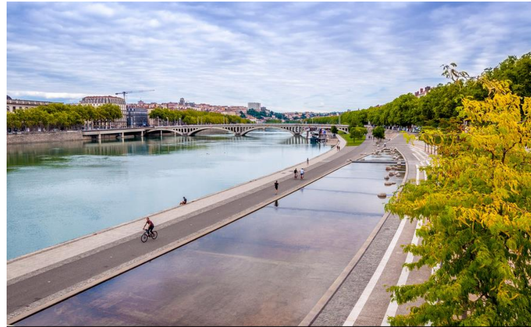
Les berges de la Saone à Lyon, France

À Lyon, par exemple, des places de stationnement ont été supprimées pour planter des arbres et introduire de la végétation.