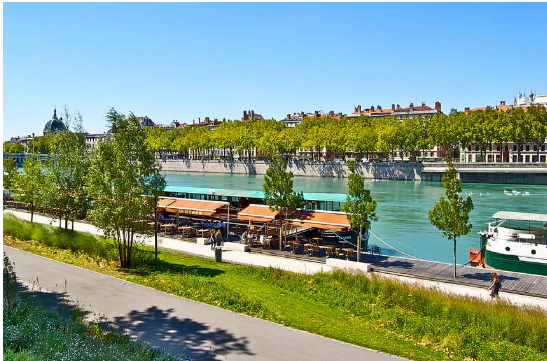
Berges du Rhône à Lyon, France

(Berge : bord d'un cours d'eau/d'un canal)