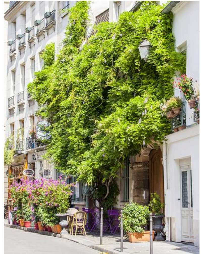
Mur végétal à Paris