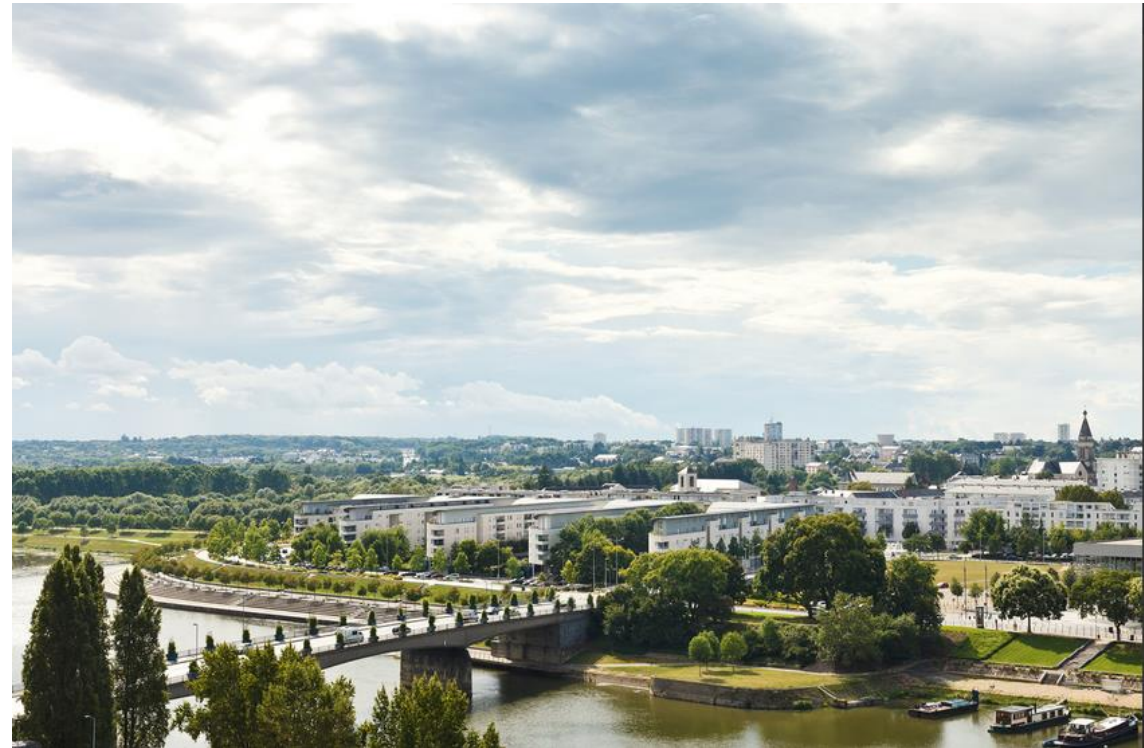
Pont de la Basse-Chaine sur la rivière de la Maine à Angers, France

Dans la ville d'Angers, les citoyens bénéficient, en moyenne, de 100 m 2 d'espaces verts par habitant.