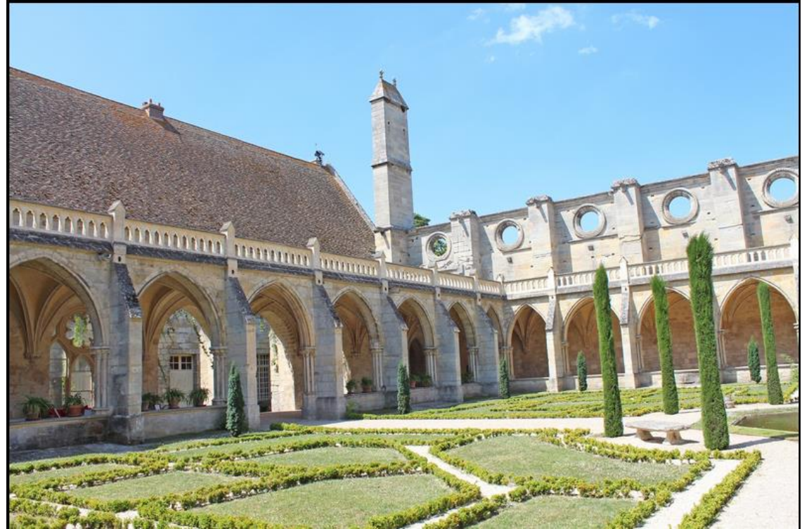
Abbaye de Royaumont (95)