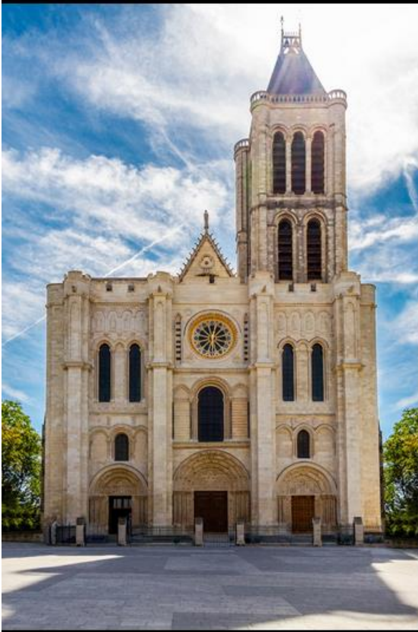
Basilique de Saint-Denis (93)