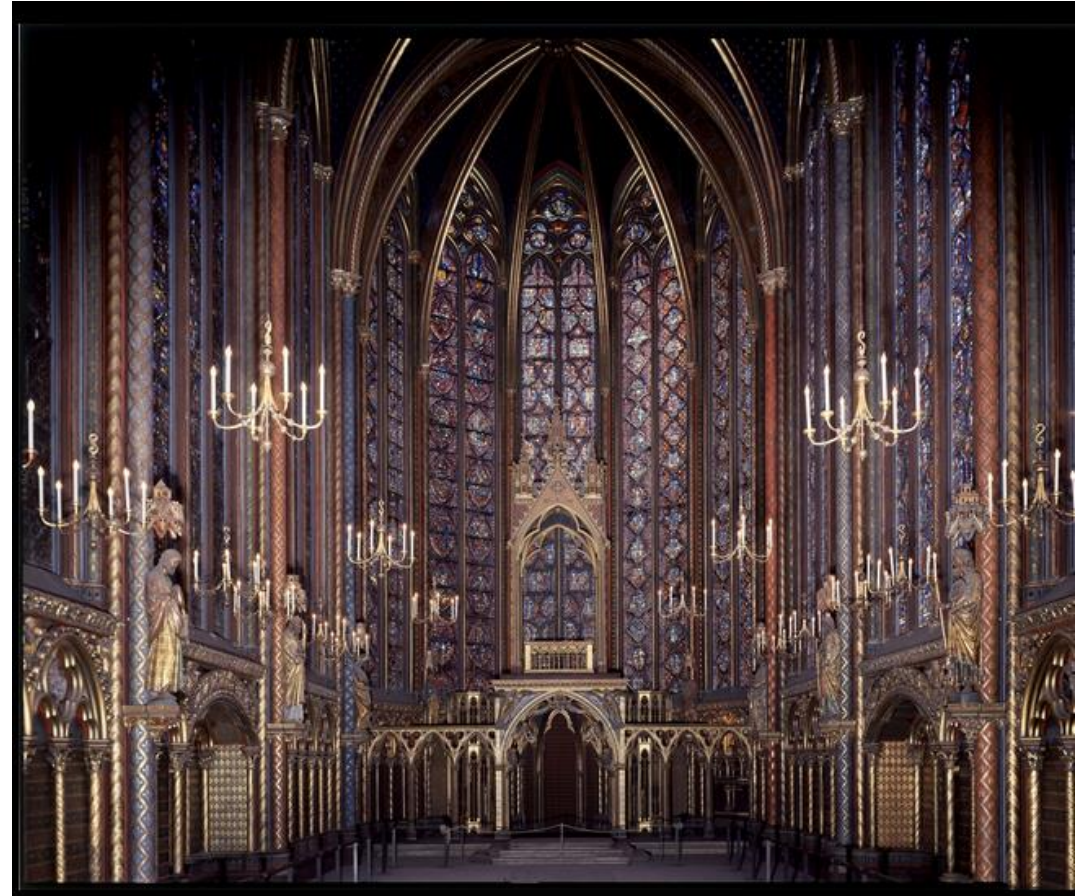
Vue intérieure de la chapelle haute de la Sainte Chapelle à Paris XIIIe siècle