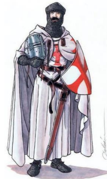
Tenue d'un combattant pendant les croisades.

La multiplication des échanges commerciaux a permis à l'Europe de découvrir les produits orientaux comme les épices, les étoffes et certains aliments comme l'abricot.