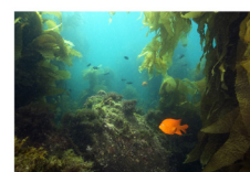
Animaux et végétaux marins