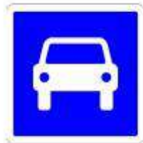
Route pour automobiles