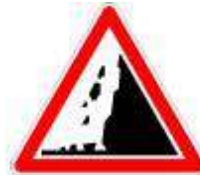
Chutes de pierres