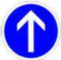
Obligation d'aller tout droit à la prochaine intersection