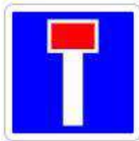
Voie sans issue