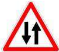
Circulation dans les deux sens