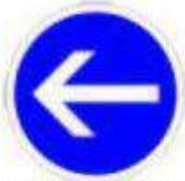
Obligation de tourner à gauche avant le panneau