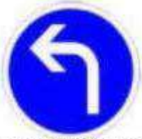
Obligation de tourner à gauche à la prochaine intersection