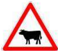
Traversée d'animaux indiqués sur le panneau