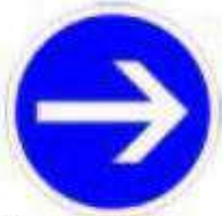
Obligation de tourner à droite avant le panneau