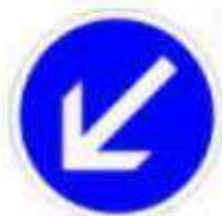
Obligation de contourner par la gauche