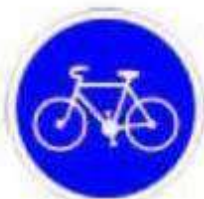
Voie obligatoire pour les cycles