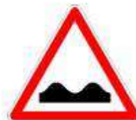
Dos d'âne ou cassis