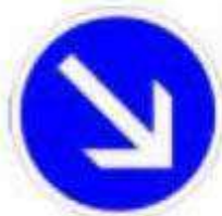
Obligation de contourner par la droite