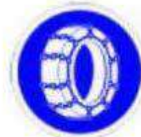
Chaînes obligatoires sur 2 roues motrices