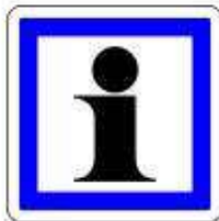
Informations sur les activités touristiques