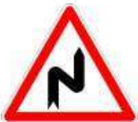
Succession de virages dont le 1er est à droite