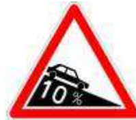
Pente au pourcentage indiqué sur le panneau