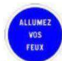
Obligation d'allumer vos feux

Les panneaux ronds à fond bleu sont des obligations, d'autres panneaux que ceux-ci existent, l'obligation est marquée dessus.