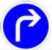
Obligation de tourner à droite à la prochaine intersection