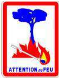
Attention au feu