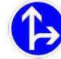
Obligation d'aller tout droit ou à droite à la prochaine intersection