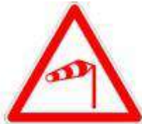
Zone souvent ventée