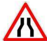
Rétrécissement de la voie