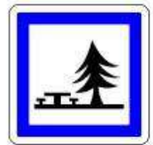
Aire de pique-nique