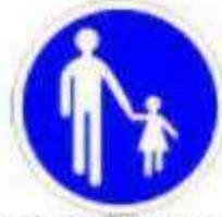
Voie obligatoire pour les piétons