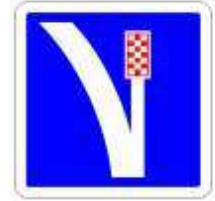
Voie de détresse à droite