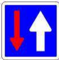
Priorité à la circulation venant dans le sens inverse