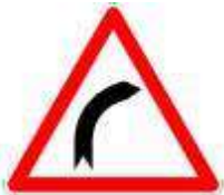
Virage à droite