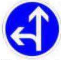
Obligation d'aller tout droit ou à gauche à la prochaine intersection