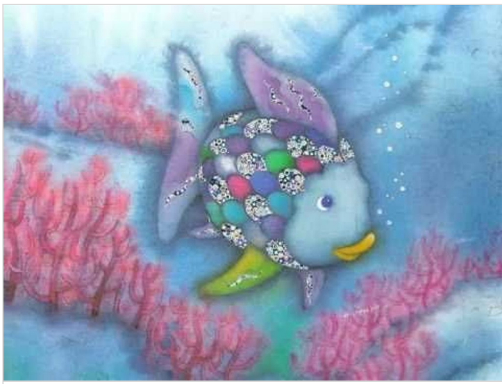
Arc en ciel le plus beau poisson de tous les océans de Veronique TISSIER