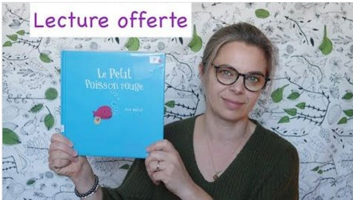
Lecture offerte - Petit poisson rouge - Eric Battut de Mes Petits Curieux