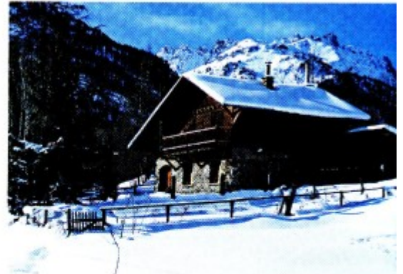
Chalet dans la vallée de la Clarée Hautes-Alpes, France

Du bois, des pierres, des plaques de lauzes : la plupart des chalets sont construits avec des matériaux que l'on trouve sur place. Le rez-de-chaussée en pierre abritait l'étable et les réserves de nourriture, l'étage en bois servait aux pièces d'habitation . Des galeries aux beaux balustres sculptés surplombaient chaque niveau. Le grenier se trouvait à quelques mètres du chalet : on y entreposait le bois, les réserves de grains mais aussi l'argent et les papiers de famille.